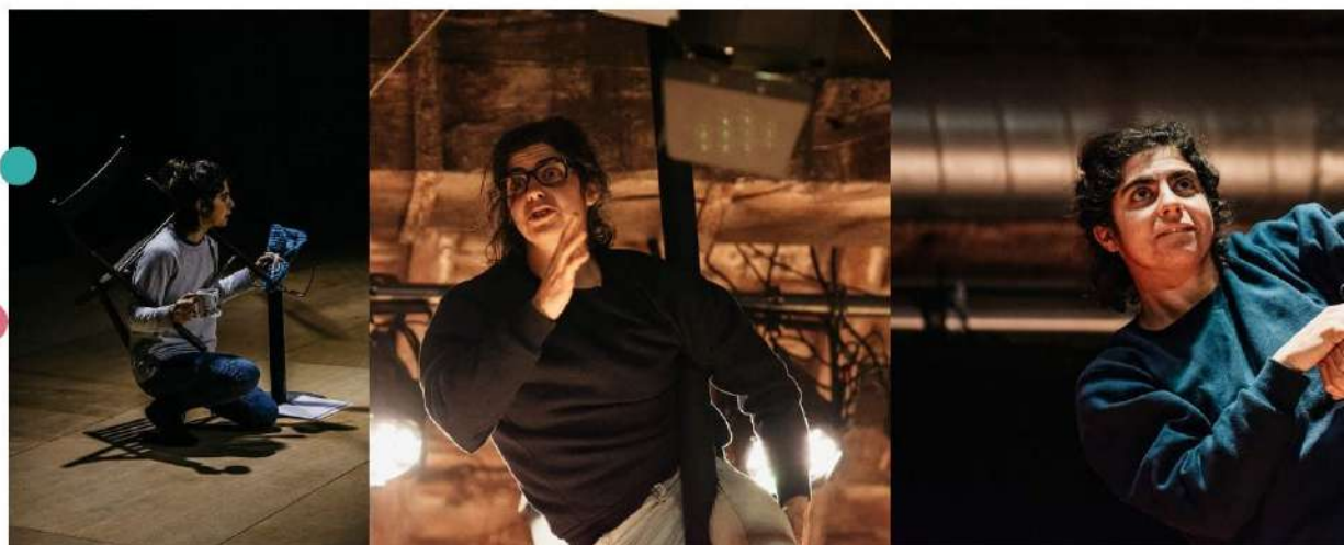
Imágenes de @bonipiks y Álex Hdez. Salgado en Andén 47, 2022